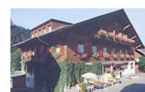
Hotel Hirschen Sangernboden