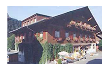
Hotel Hirschen Sangernboden